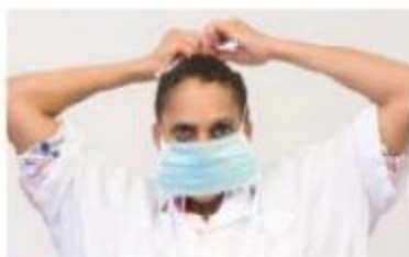
2 Posez le masque sur le nez, passez les lanières du haut au-dessus de vos oreilles et nouez-les derrière la tête.