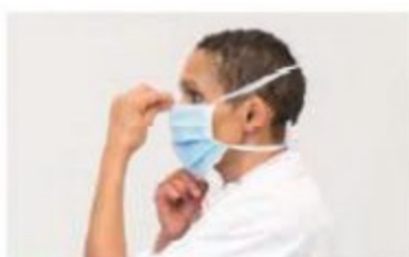
5 Ajustez le masque en l'étriant au dessous du menton.