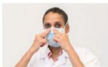
4 Modelez la baguette nasale sur votre nez afin d'obtenir une bonne étanchéité.