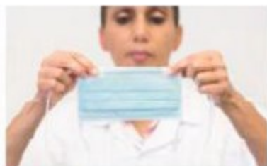
1 Sens du masque : la baguette nasale doit être en haut, le côté coloré à l'extérieur et le côté blanc contre la peau.