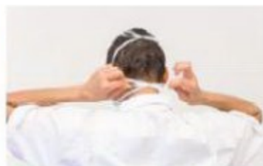
3 Passez ensuite les lanières du bas au-dessous de vos oreilles et attachez-les derrière le cou.